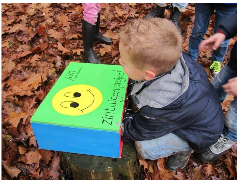
Ra ra wat zit daar in?